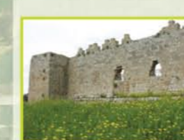
נחל רבה: נחל רבה, נחל רבה.

בריכת הנופריס: שריד אחרון של אזור הביציות הטבעי, חלק ממעיינות הירקון. הזורמים באופן חופשי לנחל ומומחים את תחילת האפיק. ייחודה של הבריכה בצמחייה שבמקום ובעיקר בנופר הצהוב. אלה הם שרידי הצמחייה הטבעית של הירקון, שהידלדלה עקב צמצום שפיעת המעיינות.