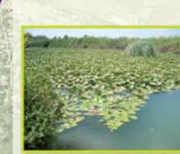
נחל רבה: נחל רבה, נחל רבה.