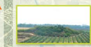
תל קנה: שרידי עיר מבוזרת ולרגליה עיר תחתונה גדולה יותר, על שטח של כ-25 דונם. הממצאים העיקריים הם מתקופת הברונזה והברזל. העיר לא נחפרה מעולם על ידי ארכיאולוגים.