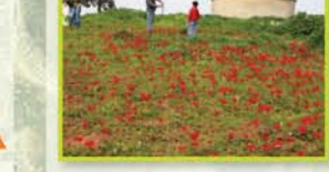
גבעת הכלניות: גבעה המתכסה בפרחי כלניות בחודשים דצמבר-מרץ. במקום התגלו קברים חפורים בקרקע ובהם ממצאים מהתקופה הביזנטית מהגבעה תצפית יפה על מרחב הירקון.